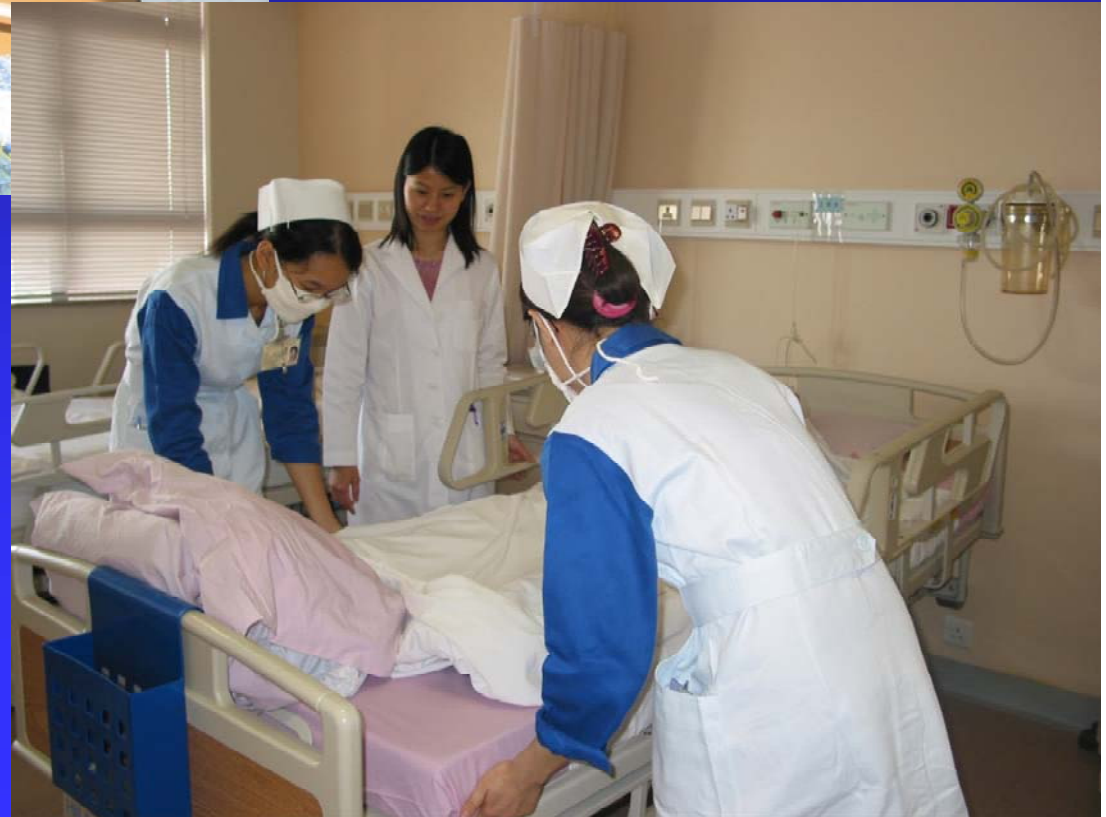
老師指導進行鋪床實習